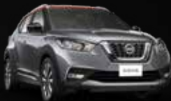
GRIS OXFORD/ NARANJA METÁLICO