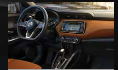
Interior con piel Naranja