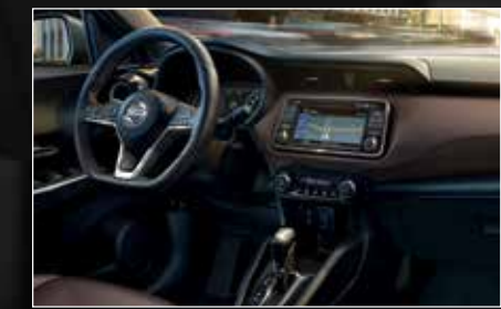
Interior con piel Café

Además de su amplio espacio interior, el diseño innovador del tablero te permite tener todo a tu alcance.