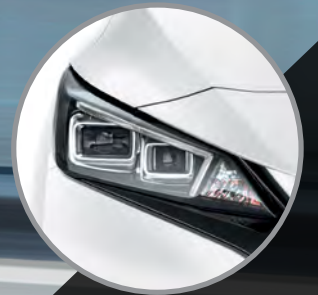
FAROS DELANTEROS LED