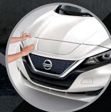
PROTECTOR DE FASCIA DELANTERO